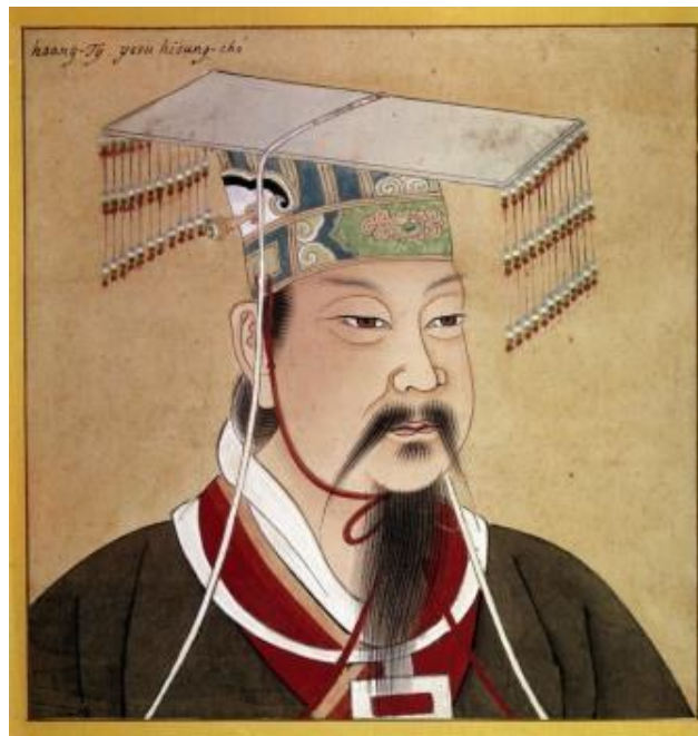
Qin Shi Huangdi (259 v.chr.-210 v.chr.)

Loop door naar 1974. Als je daar de QR-code scant, krijg je een filmpje te zien van een leger met wel 6000 soldaten uit het graf van Qin Shi Huangdi, de eerste Chinese keizer. Qin was net als Mao een dictator die veel mensenlevens op zijn geweten heeft.