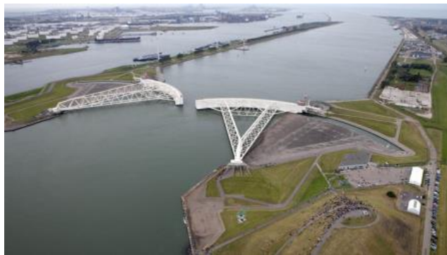
Een van de onderdelen van het Deltaplan is de 'waterdeur' bij de toegang tot de Nieuwe Waterweg. Bij erg hoog zeewater en zware storm gaan de deuren dicht. Knap bedacht!

De Nederlanders vechten al eeuwenlang tegen de gevaren van de zee en de rivieren. Ze zijn daar erg goed in. Maar soms verliezen ze. Zoals in 1953.