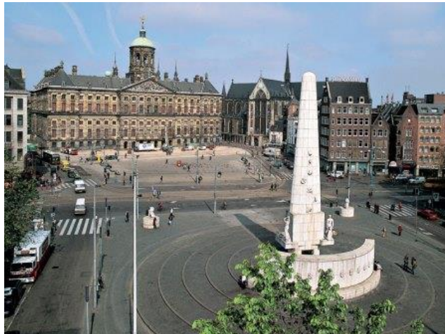
Monument voor de Nederlanders die door de tweede Wereldoorlog om het leven kwamen.

Op 10 mei 1940 vielen Duitse soldaten ons land binnen. Toen ze Rotterdam bombardeerden gaf ons leger zich over. De koningin en de regering vluchtten naar Engeland. De Duitsers hielden ons land vijf jaar bezet. Daar denken we met elkaar nog elk jaar aan terug. Op 4 mei om 8 uur 's avonds.