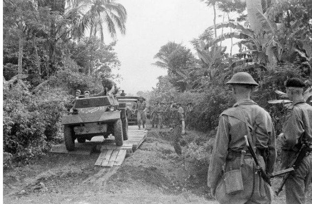
Nederlandse militaire in actie in voormalig Nederlands-Indië

Tip: Als je meer wil weten over de voormalige Nederlandse koloniën, scan dan de QR-code.