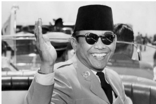
Soekarno, de eerste president van Indonesië.

Ontdek waarom 1949 voor Indonesië en ons land zo'n belangrijk jaar is geweest.