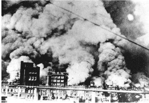
De Duitsers bombarderen Rotterdam

Reken eens uit hoe oud Anne nu geweest zou zijn?