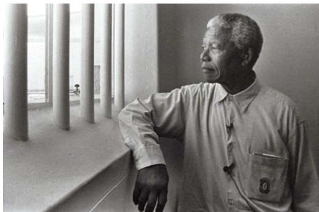
Nelson Mandela in de gevangenis. Zijn leven lijkt uitzichtloos.

En dan is het 1990. Mandela zit al 26 jaar gevangen. In dat jaar is de eerste draagbare spelcomputer te koop. De Italianen zijn bang dat de toren van Pisa zal omvallen. Maar veel belangrijker is wat miljoenen mensen op 11 februari op de televisie zien gebeuren. Lees zelf maar op 1990-W.