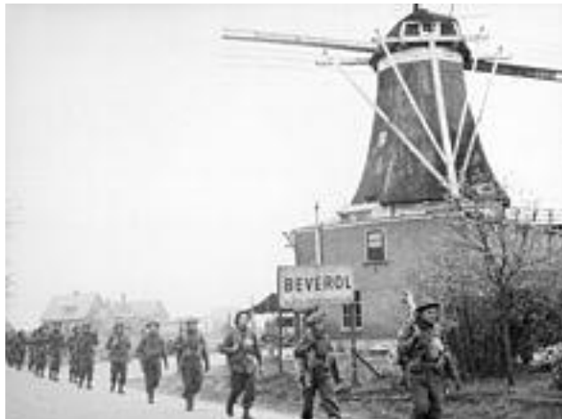
Canadese soldaten bevrijden Holten en Rijssen