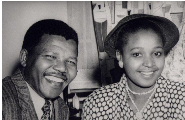
Een oude foto van Nelson Mandela en zijn vrouw Winnie.

Enkele jaren later werd ook de zwarte advocaat Nelson Mandela lid van deze groep. Hij werd gearresteerd en moest voor de rest van zijn leven de gevangenis in. Dat was in 1964.