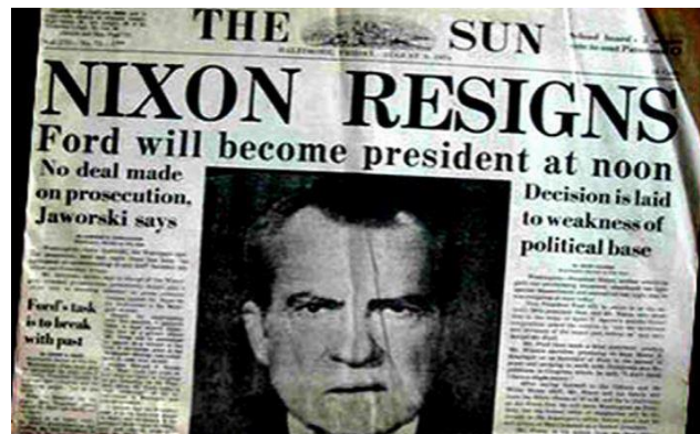
Een krant uit 1974 met het bericht dat president Nixon is afgetreden vanwege het Watergateschandaal.

Dit enorme gebouw staat in de Amerikaanse hoofdstad Washington. Het heet Watergate en is wereldberoemd geworden door een inbraak. Medewerkers van de Republikeinse president Nixon gaven opdracht in te breken in het hoofdkwartier van de Democratische Partij. Er waren namelijk presidentsverkiezingen op komst en dan is het prettig als je weet wat de Democratische presidentskandidaat voor plannen heeft. Ontdek maar hoe dat afloopt.