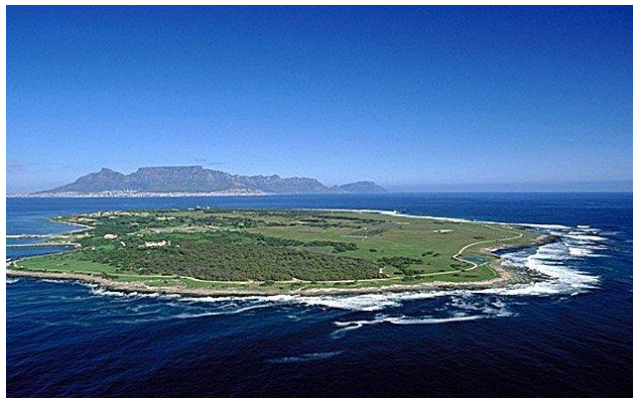
De gevangenis stond op Robbeneiland, een eilandje voor de kust van Kaapstad dat je op de achtergrond ziet liggen.

Enkele jaren later werd ook de zwarte advocaat Nelson Mandela lid van deze groep. Hij werd gearresteerd en moest voor de rest van zijn leven de gevangenis in. Dat was in 1964.