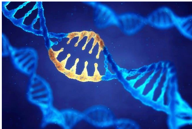
Zo ziet een DNA-molecuul eruit.

Loop nog niet verder en bekijk wat te lezen is op 1953-E.