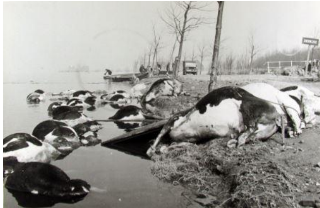
Verdronken koeien in de buurt van Zierikzee