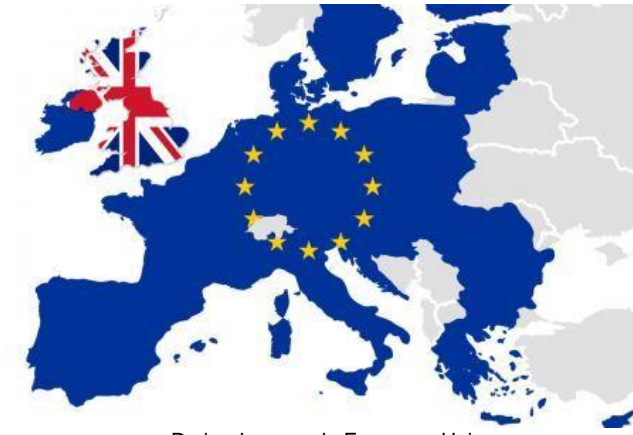
De landen van de Europese Unie