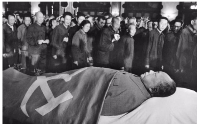
Duizenden Chinezen brengen hun leider de laatste eer.