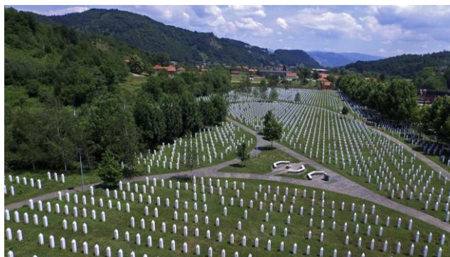
Begraafplaats in Srebrenica

Loop links langs het station naar het perron. Steek over naar jaarpaal 2000.