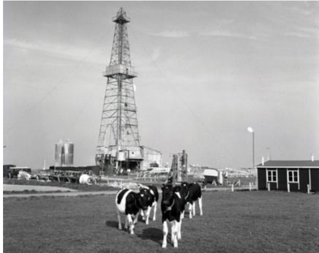
Boortoren in het Groningse plaatsje Slochteren

Als je de QR-code scant krijg je een filmpje over aankomst, verblijf en vertrek van de Amerikaanse astronauten op de maan!